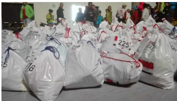
(immagine tratta dal servizio di Bag Drop all'Alpi 4000 del 2018)